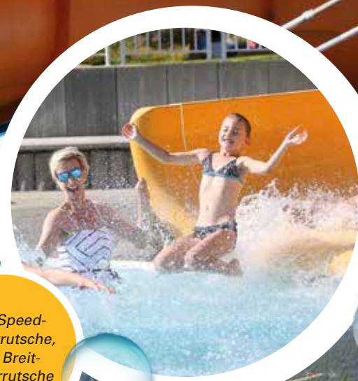
70m Speedwasserrutsche, 15m Breitwasserrutsche