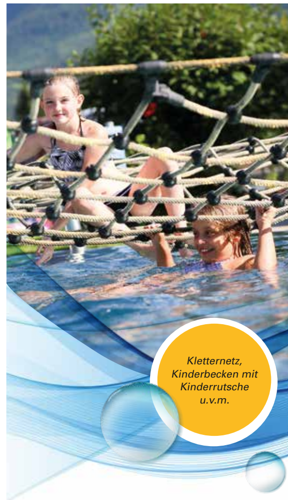
Kletternetz, Kinderbecken mit Kinderrutsche u.v.m.

Mit der Salzburger-Land Card freier Eintritt!